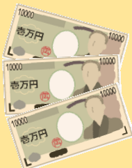
「電話で『お金』詐欺」認知件数(令和5年6月末)